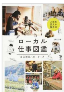
『ローカル仕事図鑑～新天地のハローワーク～』