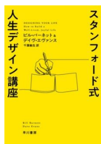
『スタンフォード式人生デザイン講座』