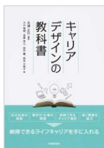
『キャリアデザインの教科書』